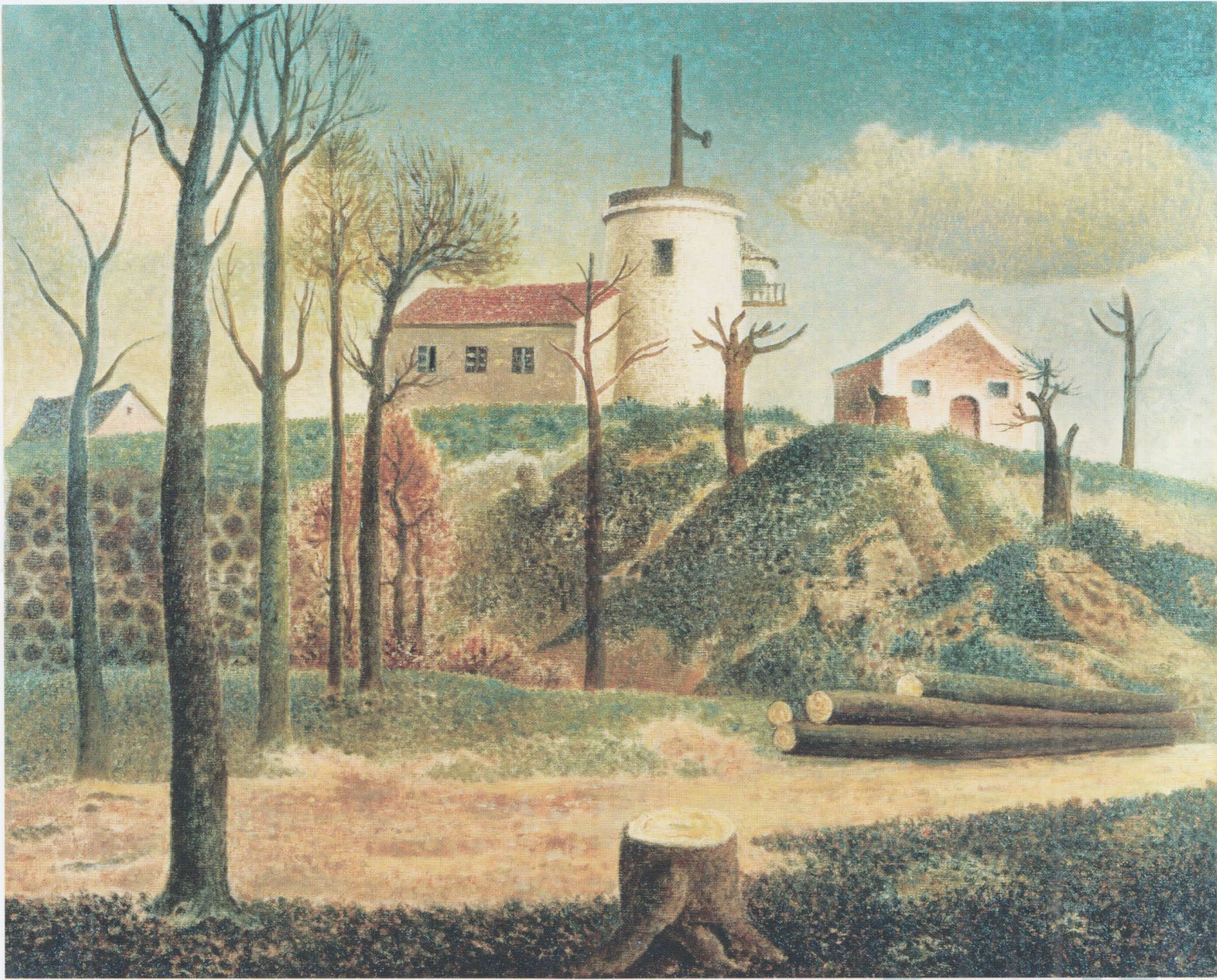
岡鹿之助《観測所》1951年 静岡県立美術館