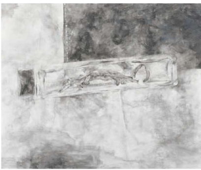
nightbirde F130 グラファイト