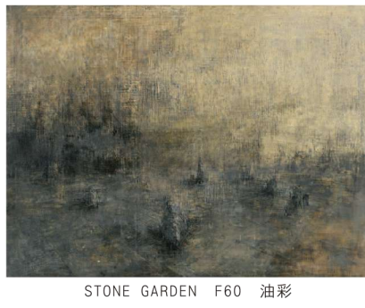
STONE GARDEN F60 油彩

アート台北 (16,18,21 たけだ美術)、Galapagos Fine (17,18,19 たけだ美術)、MIDORI展 / HUU・風展 (20,22 中之沢美術館)