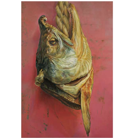
鮭II-その後 F120 ミクストメディア

NEKOTAMAGO 展 (新宿スペース0、表参道ギャラリー-219) 個展、グループ展 (銀座あかね画廊、福岡ギャラリー-尾形)