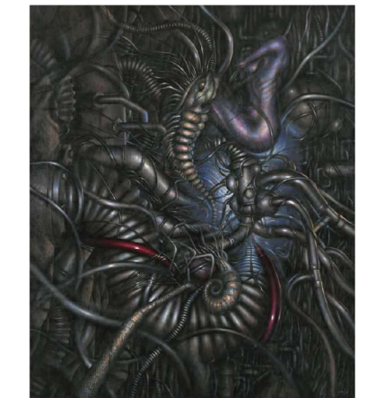
進化 F130 油彩

サボ展 (銀座アートホール)、スカラベ展 (あかね画廊)、tricolour 展 (東邦アート) 他