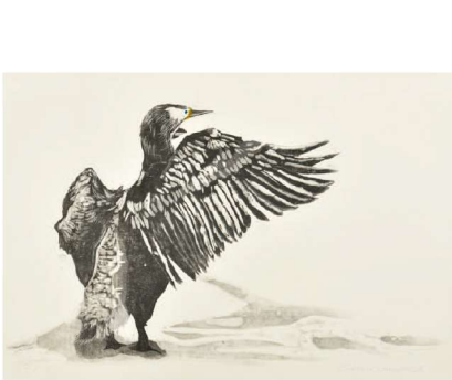
玲瓏たる 63×92 木版

第100回記念春陽展 会場：国立新美術館 会期：2023年4月19日~5月1日 春陽展 作品公開 100万円