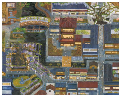
華やかな藤の街 F100 油彩