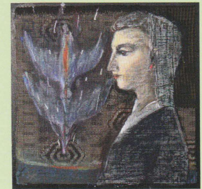
青き鳥を見た 2020 26×26.5cm