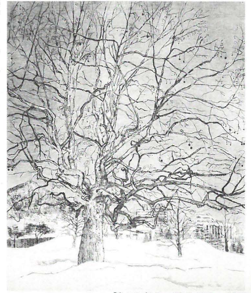
「冬のズカケ」 69.5×57.5cm 1996