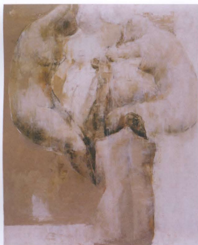
「群像—遙かなる時空の中で」