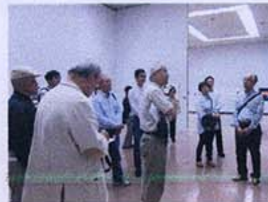
第91回春陽展大阪展会場研究会

昨年の第92回展では前年度と同様に春陽会賞1名、奨励賞2名という仲間の成果も共に喜びあい、制作の励みになっている。