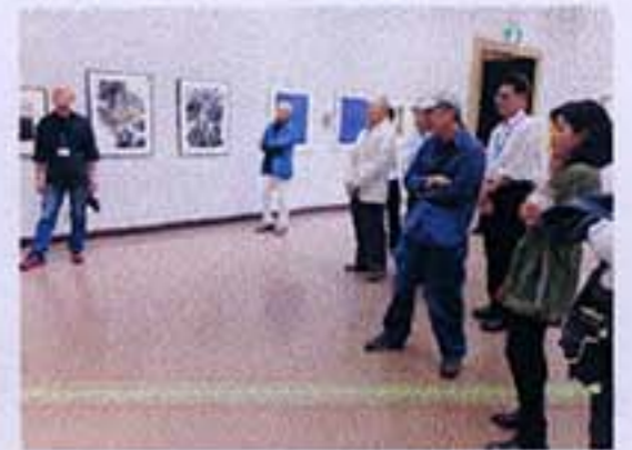
第92回春陽展大阪展会場研究会