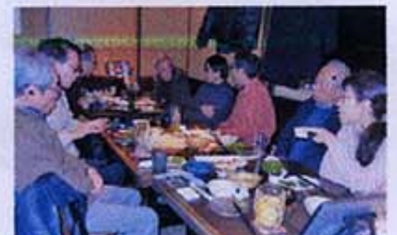
研究会後の懇親会