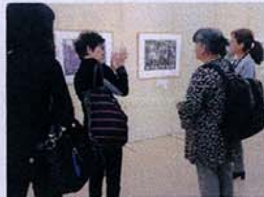
2015春陽会受賞作家展同時開催関西春陽会展2015(研究会・会場風景)