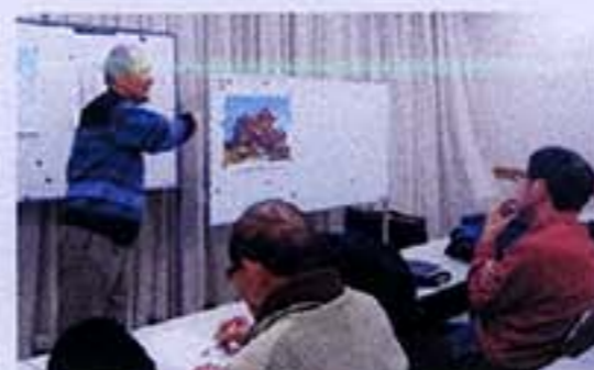
第93回春陽展出品の為の研究会